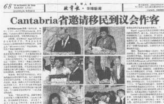
Reproducción de parte de la página sobre la Cámara.

mayor tirada en Europa. En la página 68 se pueden seguir varios momentos de la recepción oficial a los inmigrantes, la intervención de Palacio, la entrega de una placa conmemorativa al presidente; la lectura en chino de un manifiesto de agradecimiento al Parlamento y la visita al domicilio. Dicha información aparece también colgada en la edición digital del periódico ( www.ouhua.es ).