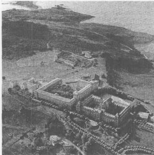
La futura sede del centro de estudios del español.

Junto a las aportaciones públicas, la iniciativa privada también participa económicamente en el proyecto, ya que los patronos fun-