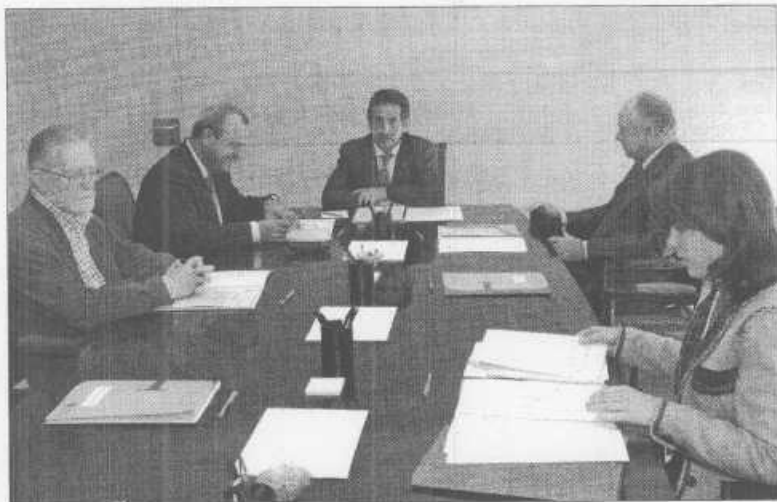
Comisión Ejecutiva del Consorcio Año Jubilar Lebaniego.

Para referirse al "dinamismo cultural" experimentado en la región, el titular de Cultura se refirió al "magnífico espectáculo que hemos disfrutado anoche (por la noche del miércoles)", cuando "pasó ante nosotros un huracán benigno, que es Bruce Springsteen con su ban-