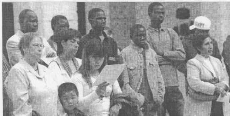
Asistentes al acto celebrado en el patio central del Parlamento de Cantabria.