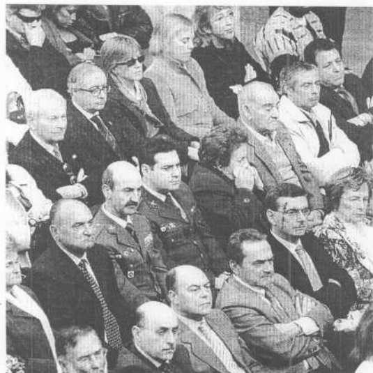
Mandos de la Guardia Civil y otros invitados. / ANDRÉS FERNÁNDEZ