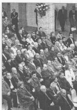
Asistentes al acto.