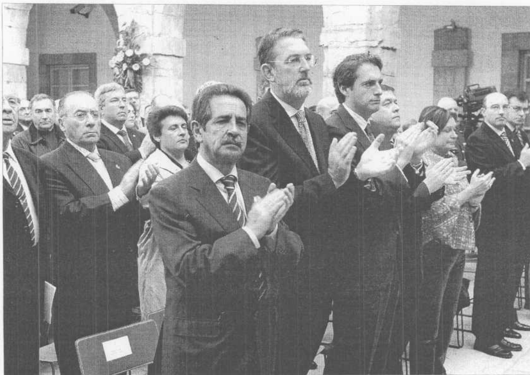
Miguel Angel Revilla, Agustín Ibáñez e Iñigo de la Serna aplauden durante un momento del acto.

El presidente de Cantabria, Miguel Angel Revilla, opinó ayer que hay "clamor" entre la "opinión pública" para que los dos grandes partidos "estén unidos" en temas "tan importantes" como la paz, la seguridad y la democracia. En declaraciones a los medios tras los actos del Día de la Constitución, Revilla aseguró que en la actualidad se vive un momento "crucial" porque "ETA está peor que nunca". Al respecto, el presidente mostró su "alegría porque el Estado de derecho funciona y los asesinos son detenidos". Revilla consideró que "si los partidos están unidos, podemos acabar con ellos pronto", y aseguró que hay un "aislamiento social" hacia los terroristas, como para él prueba el hecho de que "los asesinos no tenían refugio" y "estaban aislados en Francia". "Cada vez les va a ser más difícil", aseveró el presidente, que confió en que el terrorismo no sea un debate en las próximas elecciones generales, y advirtió a los terroristas que "si no dejan las armas, el destino que les espera es la cárcel". Miguel Angel Revilla lamentó que los actos del Día de la Constitución estuvieran "teñidos" por los hechos "tan terribles" que han sucedido esta semana y destacó los valores constitucionales y los logros de la Carta Magna.