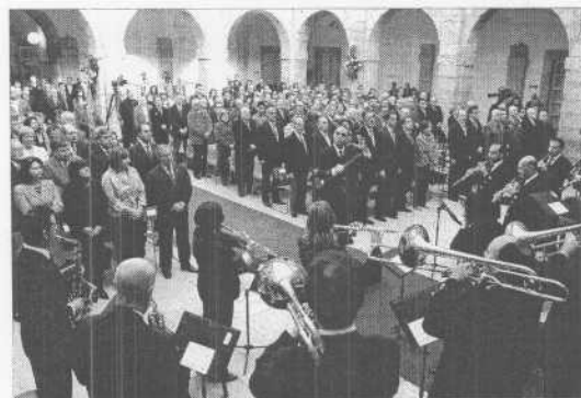
Un momento de los actos del Día de la Constitución.