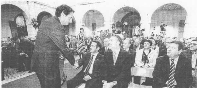
El alcalde de Santander saluda al presidente regional.

«Celebramos que, bajo el imperio de la ley, estamos garantizando los derechos humanos»