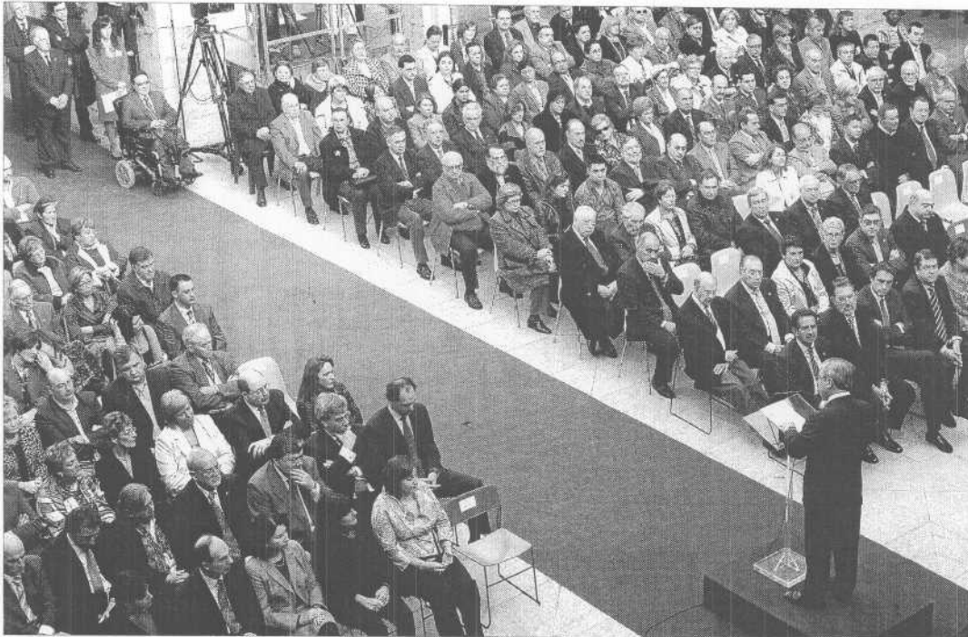
El presidente del Parlamento se dirige a los asistentes al acto del Día de la Constitución.