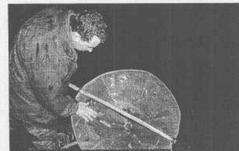
Un pescador de angulas en el río Pas.