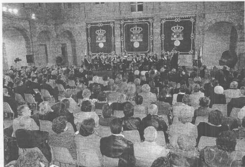
La conmemoración se cerró con un concierto de música de Mozart y una recepción.

Por ello, indicó que cualquier reforma debe estar basada «en el consenso máximo de los partidos políticos y de la sociedad». Rodríguez señaló que «lo que no se puede permitir, que se había conseguido con la anterior reforma, es que Cantabria se quede como una comunidad autónoma de segunda o de tercera». Añadió que todas las regiones «deben tener los mismos derechos y deberes», algo que, a su juicio, no se cumple con el Estatuto catalán que «ha ido más allá de la Constitución» creando autonomías de primera y segunda.