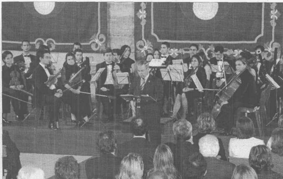
El presidente del Parlamento de Cantabria, Miguel Ángel Palacio, durante su discurso.