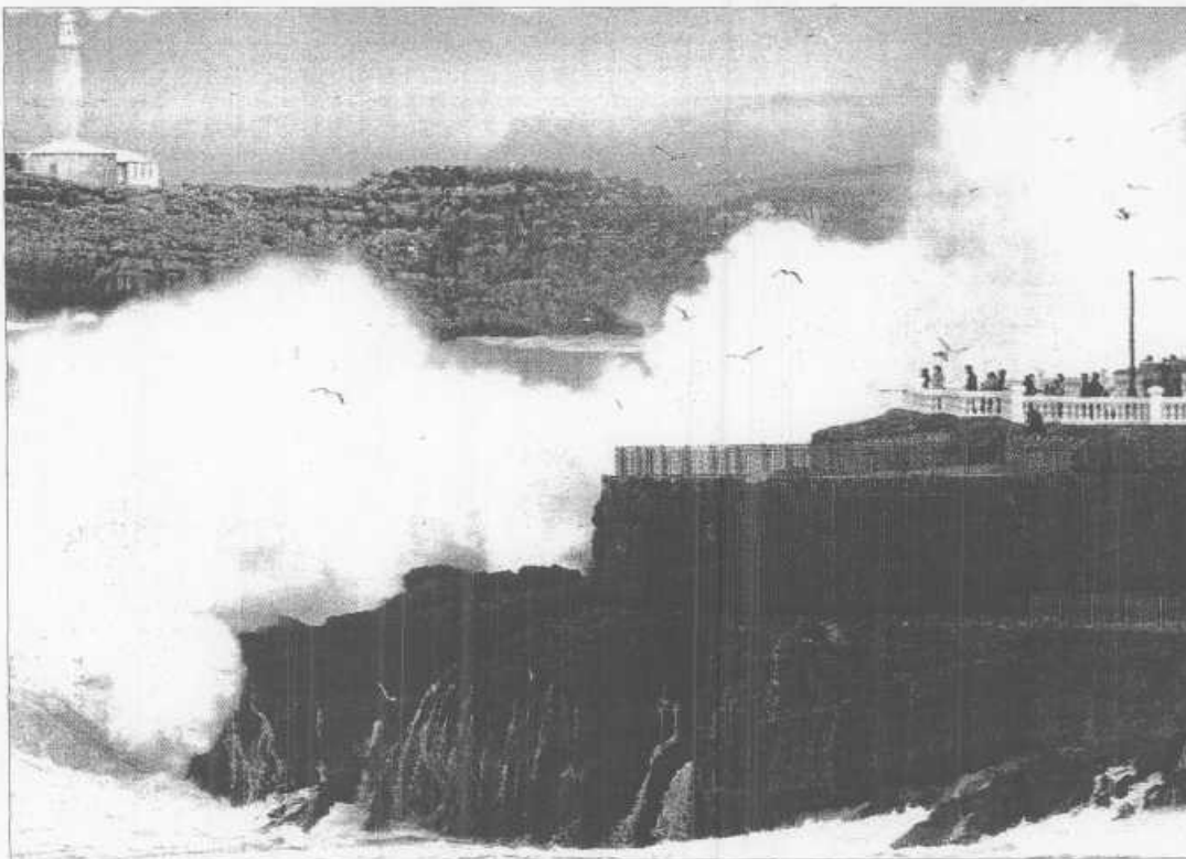
FUERTE OLEAJE EN LA COSTA CANTABRA. El fuerte temporal marítimo producido por los intensos vientos de componente oeste y noroeste que azota el litoral cántabro provocó ayer un intenso