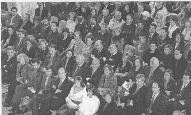
Autoridades y público presente en el acto celebrado en el Parlamento.

Para ello, reclamó el concurso de todas las fuerzas políticas, que deben unirse para que "el final del terrorismo sea una victoria de la democracia" y alcanzar el acuerdo "que tanto desea" la sociedad, "en la seguridad de