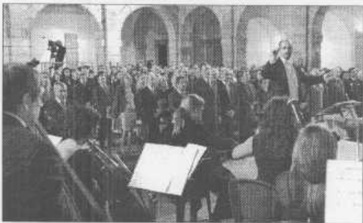
Una de las actuaciones de la velada musical.