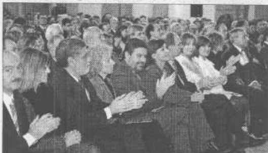
Consejeros del Gobierno de Cantabria y diputados regionales.

La sinfonía fue compuesta en 1788 durante un período de gran productividad del compositor. La pieza está orquestada para flauta, oboe, clarinete, fagot, cornos, y una sección de cuerdas (primeros y segundos violines, violas, cellos y contrabajos) y ha sido elegida para la ocasión por coincidir su creación con la realización en Santander del proyecto del Hospital de San Rafael, sede del actual Parlamento. Tras la interpretación del Himno de España, el presidente y la Mesa del Parlamento ofrecieron una recepción a todos los invitados a esta conmemoración del Día de la Constitución. Este acto se ha consolidado, progresivamente, como uno de los momentos de mayor calado democrático por que el presidente del Parlamento, en nombre de la Institución que representa, se dirige a la sociedad cántabra con un mensaje institucional que pretende realzar los valores democráticos.