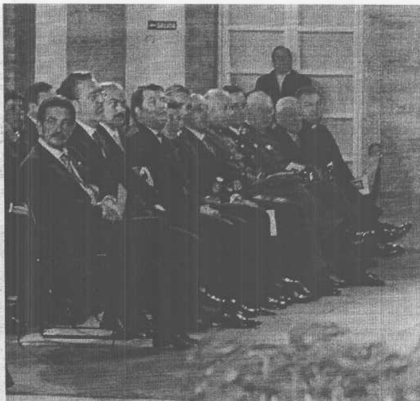
Miguel Ángel Revilla, junto al delegado del Gobierno y otras autoridades, asistió al acto institucional celebrado