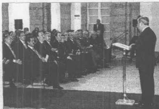
Palacio lee su discurso ante las autoridades regionales.

El presidente del Parlamento cántabro, Miguel Ángel Palacio, hizo ayer un llamamiento a "cerrar filas, terminar discusiones" y buscar un acuerdo de todas las fuerzas políticas para acabar con el terrorismo mediante los procesos que permita utilizar la Constitución Española. El Parlamento acogió los actos del Día de la Constitución. Páginas 2 y 3