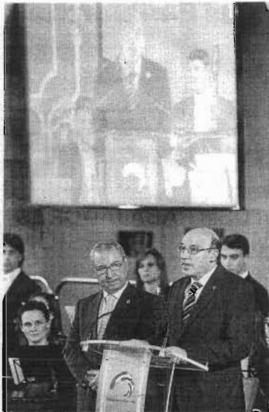
El rector de la Universidad (a la derecha) durante su discurso tras recibir de manos de Palacio (izquierda) la Medalla de Oro del Parlamento de Cantabria.