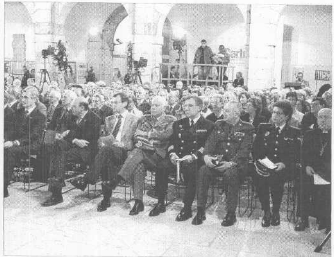
Autoridades y público asistente ayer a la conmemoración oficial.