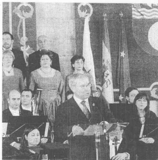
El presidente del Parlamento se dirige a los asistentes.